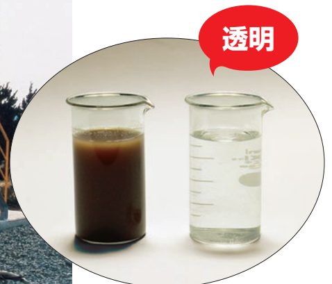
曝気槽水(左)と処理水