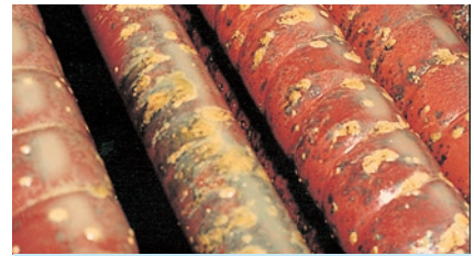
煙管ボイラに発生した腐食