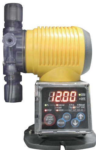
アクアスフィーダー T-703TY