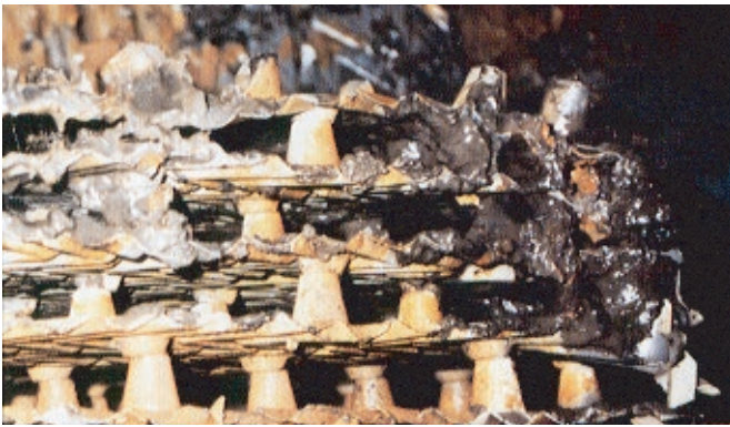
冷却塔内に付着したスライムの重みにより座屈した充填剤